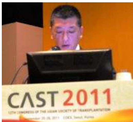
池本先生のoral presentation。英語の質問も難なく返答。