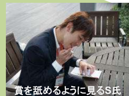
賞を舐めるように見るS氏